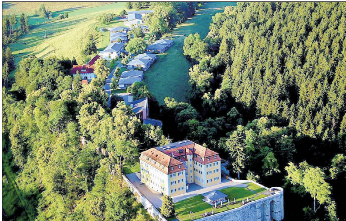
Auf dem Areal des früheren Behindertenheims Grafeneck wurden 1940 insgesamt 10 654 Menschen umgebracht. In einem Jahr soll hier die Spur der Erinnerung starten, die als Farbstrich bis in die Stuttgarter Innenstadt führen wird.

Es ist geplant, eine Farbspur von Grafeneck bis in die Stuttgarter Innenstadt vor das Innenministerium zu malen. Das soll ganz konkret durch eine Vielzahl von beteiligten