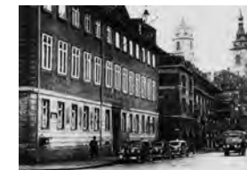
Ziel der Spur: Innenministerium Stuttgart.