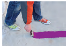
Die 10 cm breite violette Farbspur

Vom 13. bis 16. Oktober 2009 soll mit einer „ Spur der Erinnerung “ in Form einer auf den Boden gemalten violetten Farbspur von Grafeneck auf der Schwäbischen Alb zum Innenministerium in Stuttgart an die Beteiligung der öffentlichen Verwaltung als Vertreter des Staates bei den Kranken- und Behindertenmorden erinnert werden. Es ist dann 70 Jahre her, dass mit der Beschlagnahme des damaligen Behindertenheims Grafeneck der evangelischen Samariterstiftung die Voraussetzungen für die „Vernichtung lebensunwerten Lebens“ geschaffen wurden. Vom 13. bis 16. Oktober 2009 werden zahlreiche Hände unterschiedlichster Teilnehmerinnen und Teilnehmer einen „Gedankenstrich“ von Grafeneck bis Stuttgart malen – und damit unterstreichen, dass alle Menschen das gleiche Recht auf Leben haben.