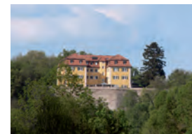
Ausgangspunkt der Spur: Grafeneck